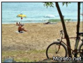
Още снимки от "Плажът и морето"

В рамките на събитието проф. Марти изнесе лекция на тема: "Нов метод за класификация на интерстицилната фиброза и тубулна атрофия при аlogenна бъбречна трансплантация и трансплантация на други органи". XXII-рият носител на почетното звание ще вземе участие на XX-ия Дунавски симпозиум по нефрология съвместно с Европейската бъбречна асоциация - Европейската диализна и трансплантационна асоциация (ERA - EDTA) и Световната бъбречна асоциация (ISN), на който Варна ще бъде домакин в периода 28 - 30 юни.